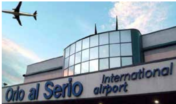
CdA SACBO approva progetto bilancio di esercizio 2015. Ricavi per 117 milioni di euro