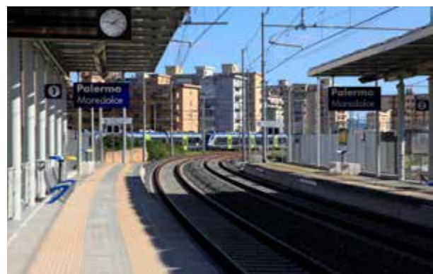
Passante ferroviario di Palermo: inaugurate le fermate Mareddolce, Guadagna e Lolli