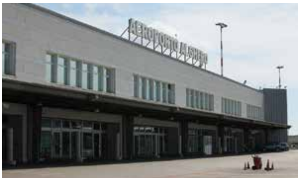
Aeroporto di Alghero: +4,3% di passeggeri a gennaio. Ancora un segno positivo