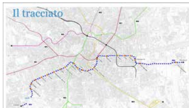
Milano: al via la prima fase di cantierizzazione leggera per M4. A fine lavori +20% alberi lungo tratta