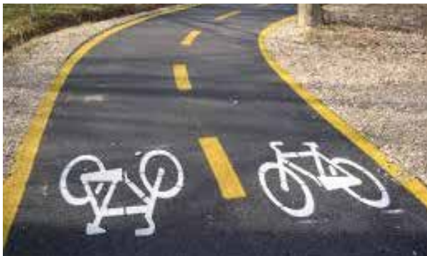
Liguria: presentato il progetto Edu-Mob per realizzare un percorso ciclabile transfrontaliero