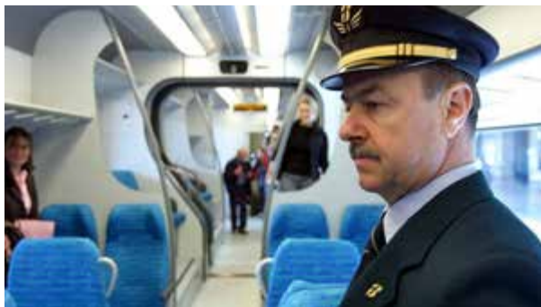
Campania: oltre 15mila controlli in 3 giorni nel corso dell'operazione antievasione di Trenitalia