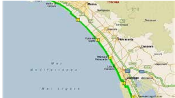
Autostrada Tirrenica: Sat presenta il lotto di Capalbio a Comune e Regione