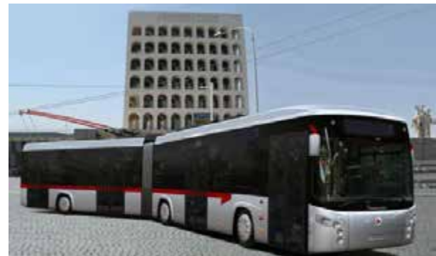
Roma: entro l'estate i filobus viaggeranno tra Laurentina e Tor Pagnotta. Al via test dei mezzi