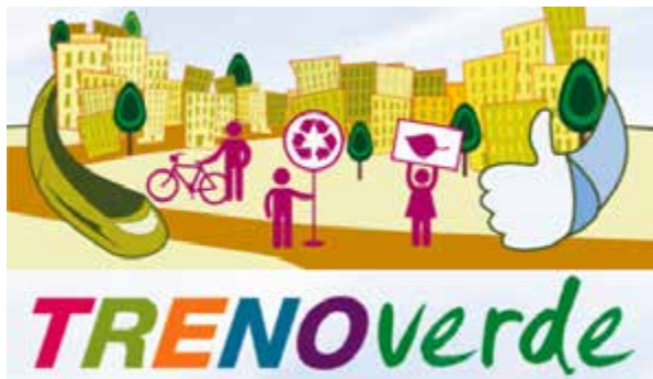
Treno Verde 2016: un nuovo modello di mobilità sostenibile per il Gruppo FS Italiane