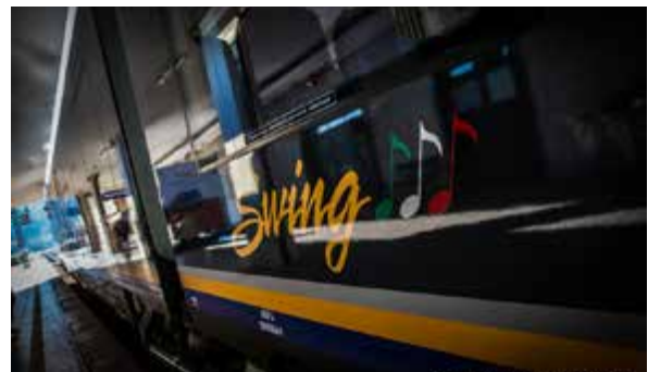
Basilicata: arriva Swing, il nuovo treno diesel per i pendolari lucani