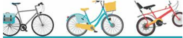
Bike Challenge Milano: premiate le aziende dell'area metropolitana che hanno "pedalato di più"