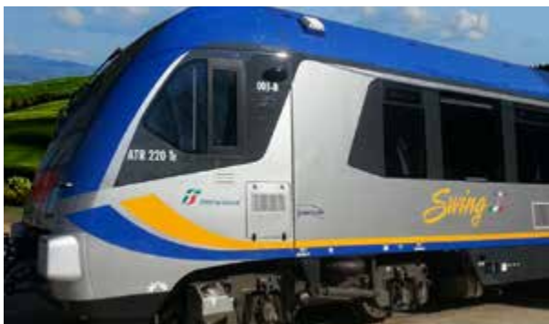
Veneto: presentato Swing, il nuovo treno diesel dedicato ai pendolari veneti