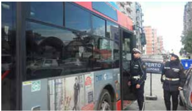
Bari: controlli sui bus cittadini per i ticket di viaggio. A gennaio acquistati più di 18.000 biglietti