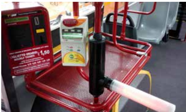
Bologna: cala l'evasione sui bus Tper. Dati molto positivi sulle tre linee dotate di tornelli