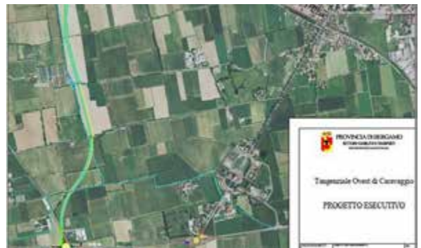
Bergamo: inaugurata la Tangenziale Ovest di Caravaggio che collega la BreBeMi con la strada Rivottana