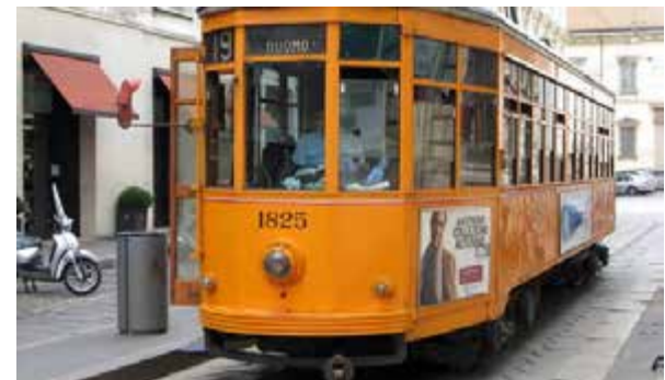
Milano: il Consiglio comunale approva lo statuto dell'Agencia per il trasporto pubblico locale