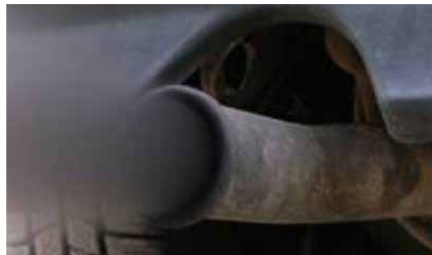
Misure antimog: in Toscana avviato il tavolo di coordinamento con i Comuni