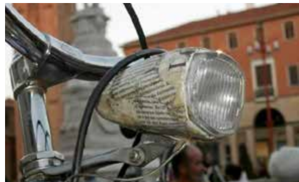
Prato: al via una serie di incontri sul Piano urbano della mobilità sostenibile