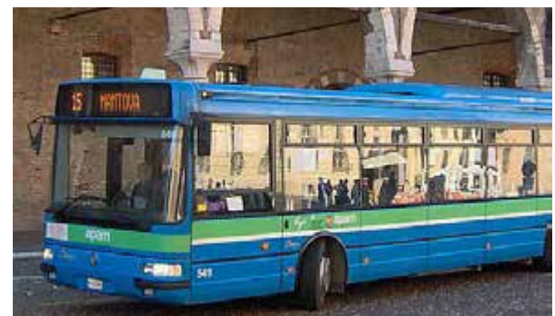
Mantova: Apam presenta "Giù le mani", progetto contro vandalismo rivolto ai fruitori dei mezzi pubblici