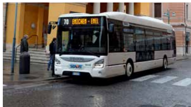
Il parco mezzi di Start Romagna si arricchisce di 4 nuovi bus Urbanway Iveco