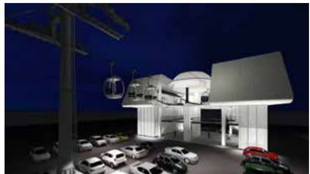
Genova: presentato il progetto del collegamento tra aerostazione e ferrovia