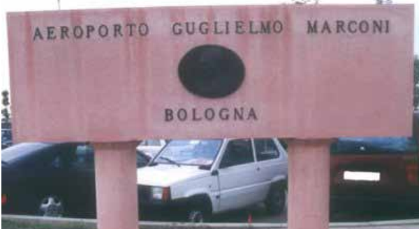
Firmato il contratto di programma tra ENAC e società di gestione aeroporto Marconi di Bologna