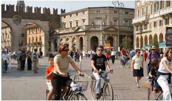
Verona: presentata l'iniziativa "memo ecologico" per facilitare la ciclabilità in città