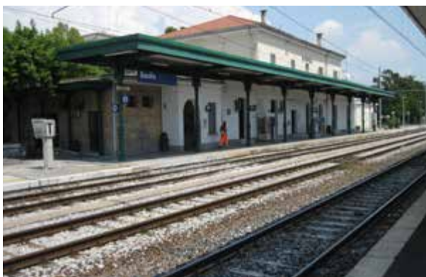
Pordenone: sottoscritto atto per riattivazione intera tratta Sacile-Gemona